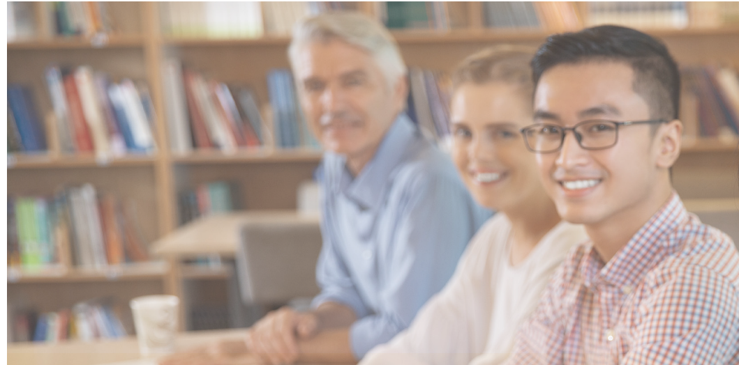
Table de concertation des personnes âgées du Haut-Saint-François