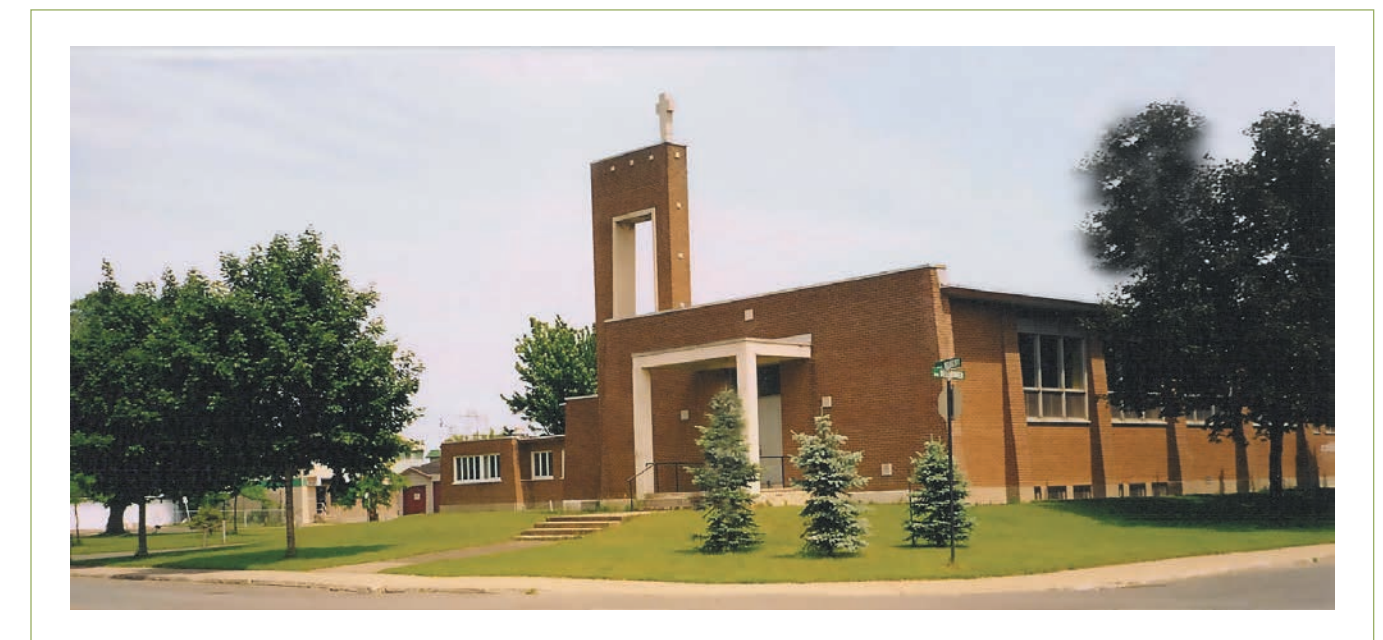
Table de concertation des aînés CSSS Pierre-De Saurel « Agir pour mieux vieillir »