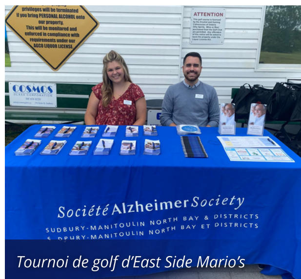
Tournoi de golf d'East Side Mario's

Nos programmes de jour pour adultes Santé Bistro ont enregistré