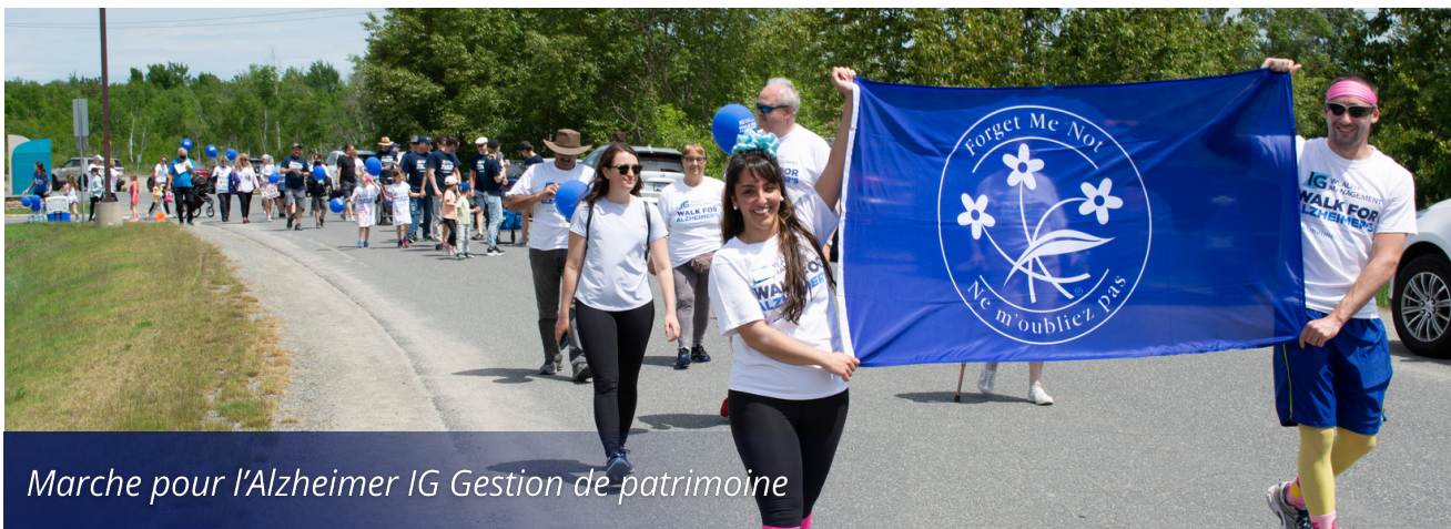
Marche pour l'Alzheimer IG Gestion de patrimoine