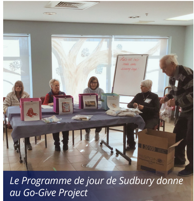
Le Programme de jour de Sudbury donne au Go-Give Project