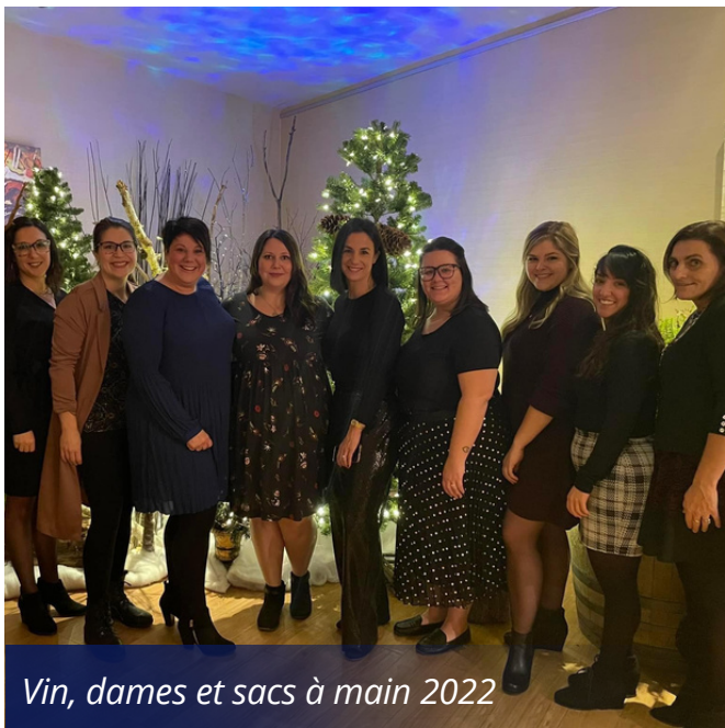
Vin, dames et sacs à main 2022

L'équipe responsable de l'éducation a accueilli plus de