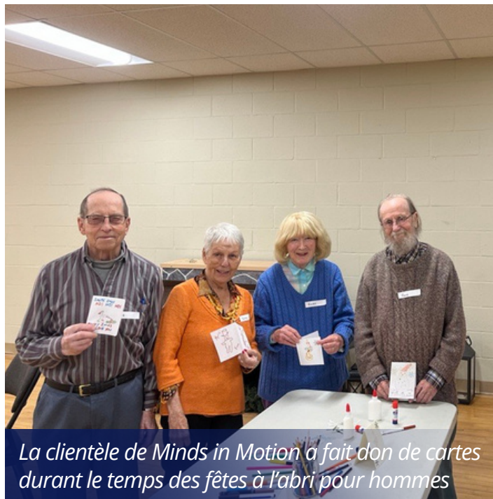
La clientèle de Minds in Motion a fait don de cartes durant le temps des fêtes à l'abri pour hommes

Notre équipe de STCO a prodigué des soins à 9 744 clients et clientes