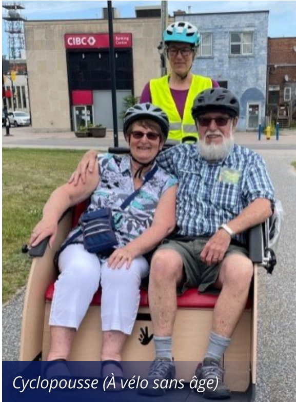
Cycloousse (À vélo sans âge)

Offert plus de 6 690 heures de soins par l'intermédiaire de troussees d'activités à domicile